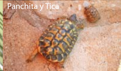
Panchita y Tica