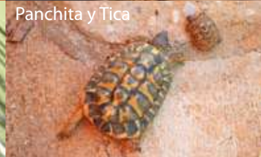
Panchita y Tica