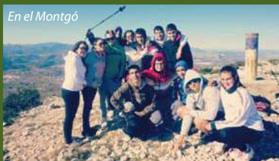
En el Montgó