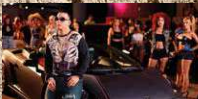
¿Escuchas lo que oyes?