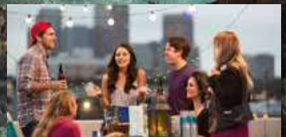
Sé anar de festa?