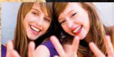
Amics per sempre