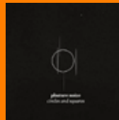
PHUTURE NOIZE Circles And Squares