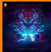
D-BLOCK & S-TE-FAN Ghost Stories