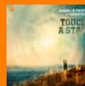
ADARO & B-FRONT FT. DAWNFIRE Touch A Star