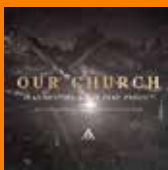
HEADHUNTERZ & SUB ZERO PROJECT Our Church