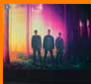
SUB ZERO PROJECT & PHUTURE NOIZE We Are The Fallen