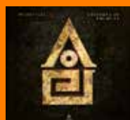
WILDSTYLEZ Children Of Drums