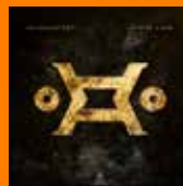
HEADHUNTERZ Leap Of Faith