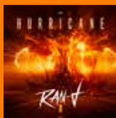
RAN-D - Hurricane