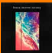
PHUTURE NOIZE Black Mirror Society