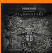
HEADHUNTERZ & SOUND RUSH FT. Eurielle Rescue Me