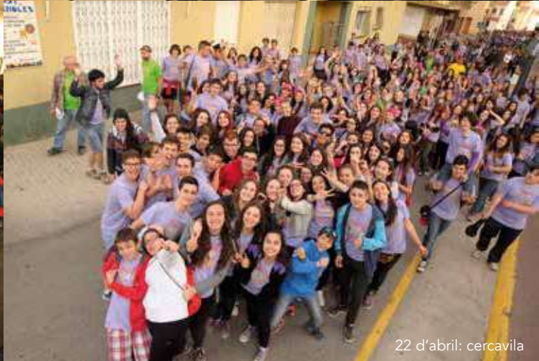
22 d'abril: cercavila