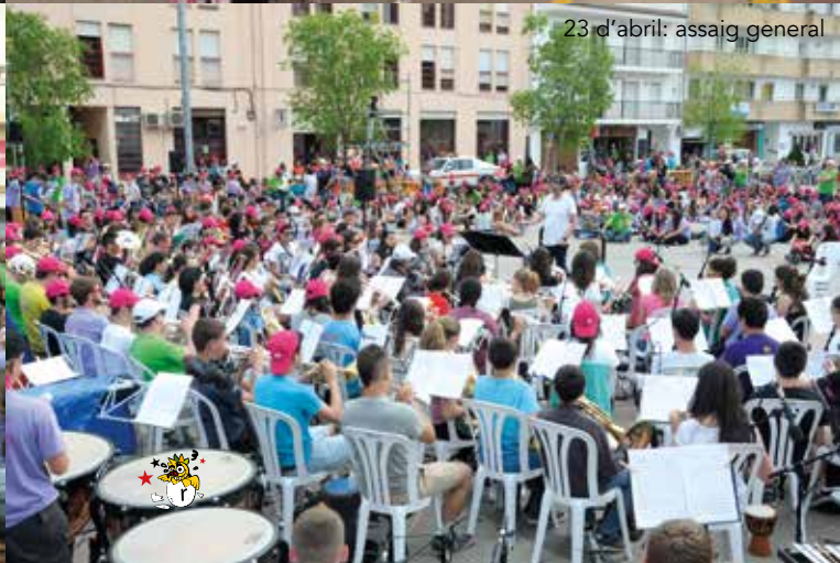
23 d'abril: assaig general