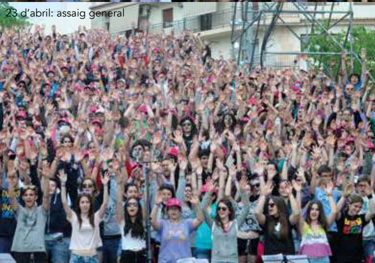
23 d'abril: assaig general