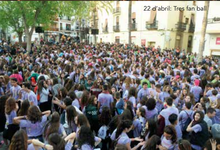
22 d'abril: Tres fan ball