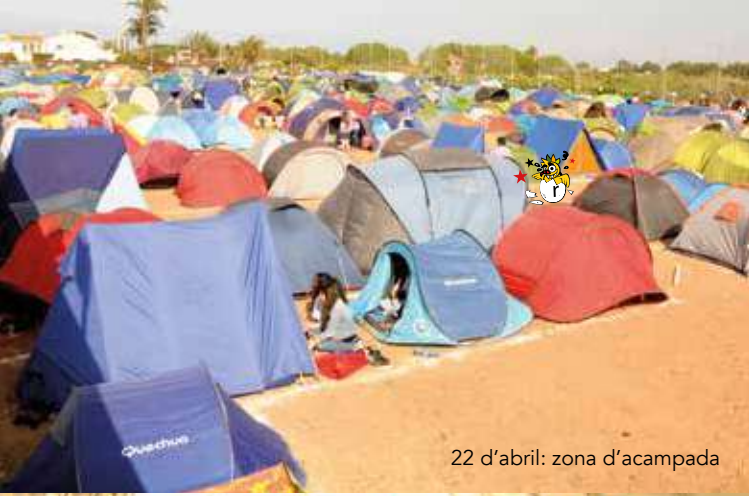
22 d'abril: zona d'acampada