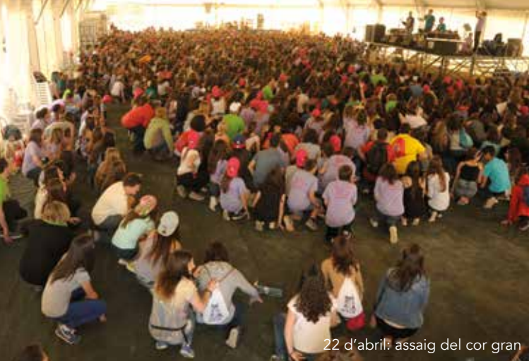
22 d'abril: assaig del cor gran