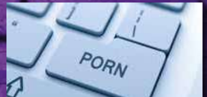
Distorsionant la realitat