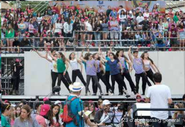
23 d'abril: assaig general