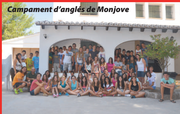
Campament d'anglès de Monjove