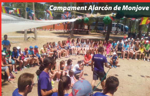
Campament Alarcón de Monjove

Si tens alguna foto interessant que vols que publiquem, ens la pots enviar abans del 18 d'octubre a: monjove@monjove.net , i la publicarem.