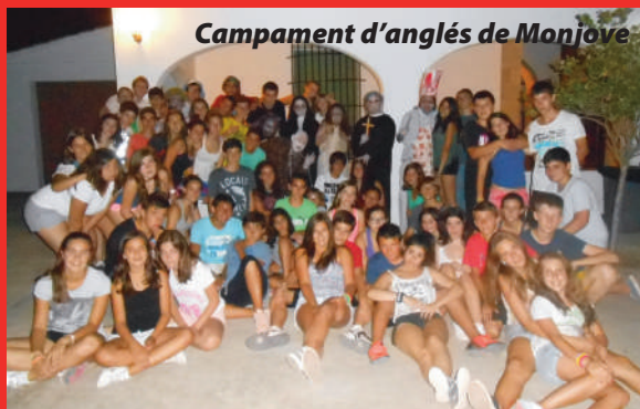
Campament d'anglès de Monjove