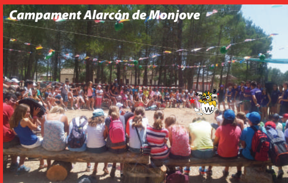
Campament Alarcón de Monjove